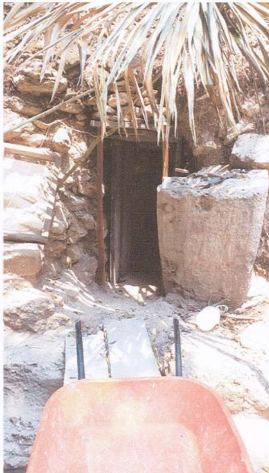
Figura 3. Proceso de limpieza y documentación de la Tumba 01 del Edificio B-20 –izquierda– y apuntalamiento del túnel que conduce al recinto mortuario –derecha–.