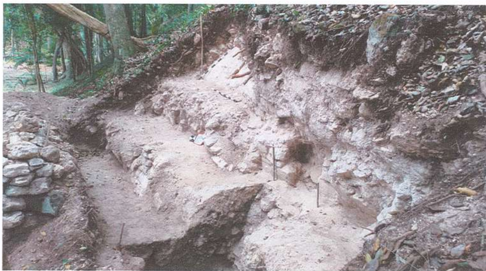
Figura 2. Cuerpos del basamento localizados en el eje central, fachada este, del Edificio B-20, que se investigaron con la excavación de la unidad 01-33.