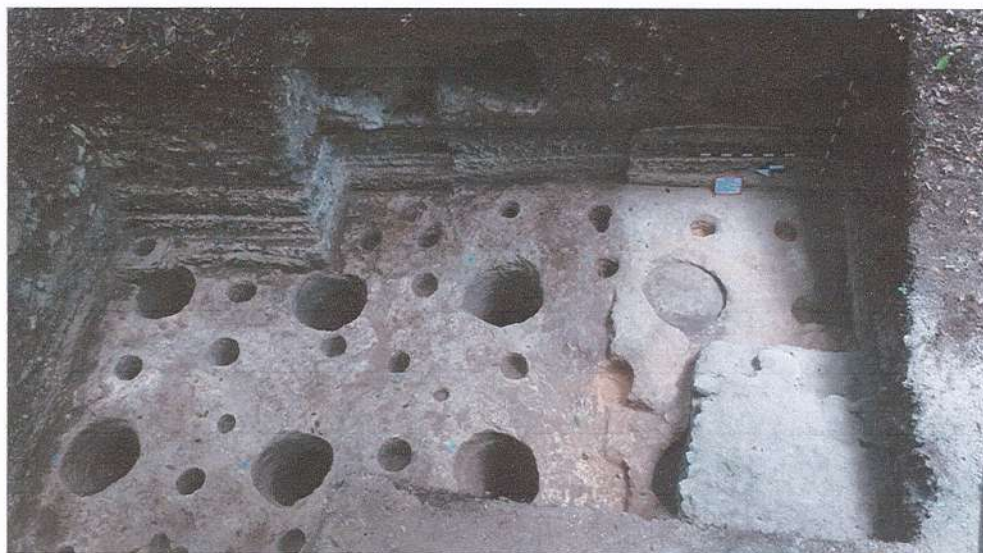
Figura 1. Área de los chultunes excavados con la Operación 50A, a la derecha se encuentran los chultunes 11, 12 y 13 encontrados durante el mes de mayo del presente (Foto. Suarlin R. Cordova 2021).

ubicadas en la parte inferior del recinto de la fachada norte del edificio. La consolidación se realizó en forma de talud con desplome hacia el sur con el objetivo de mitigar cualquier amenaza que pueda atentar con la conservación del edificio. El sector restaurado tuvo dimensiones de 3.40 m de alto, 3.20 m de largo este-oeste por 2.70 m de ancho norte-sur, por lo anterior, se consolidó un área de 8.64 m 2 y con volumen de 29.38 m 3 .